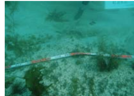
海中での引上げ前のアスファルトマッ ト表面の海藻植生状況