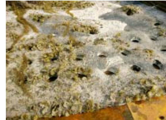
海中より引上げ後のアスファルトマッ ト表面の状況