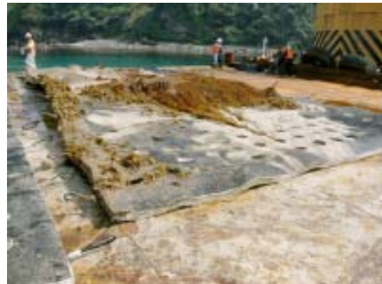
海中より引上げ後のアスファルトマッ ト表面の状況