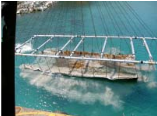
海中よりのアスファルトマット引上げ状況