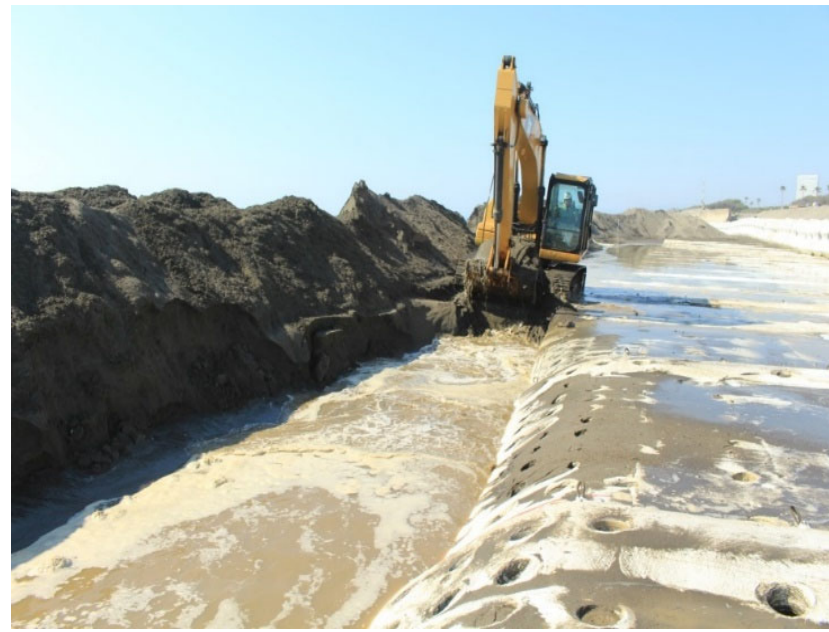
先端部掘み込み状況