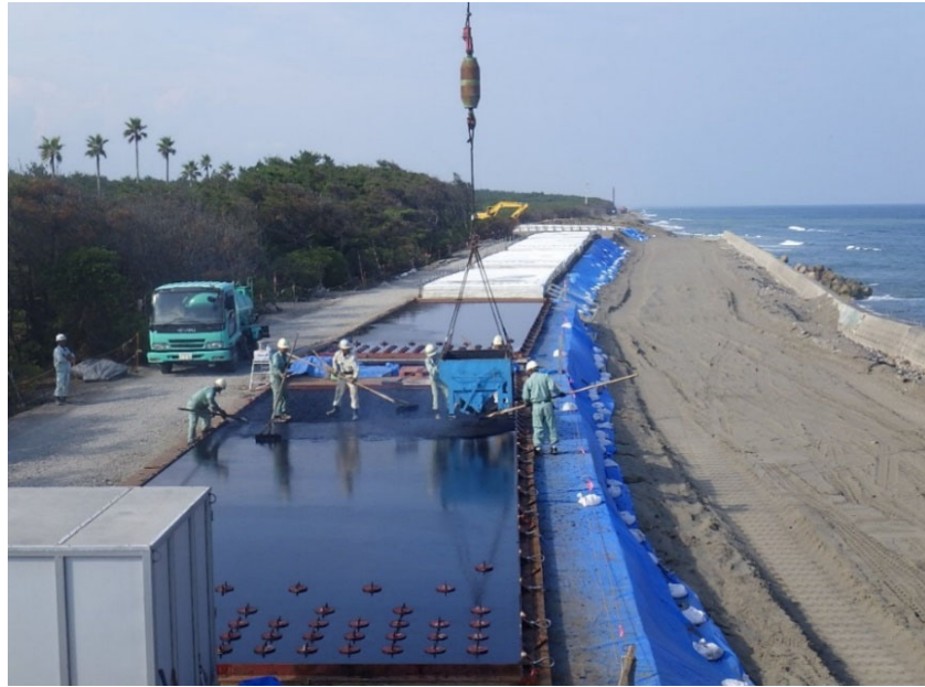
アスファルトマット製作状況