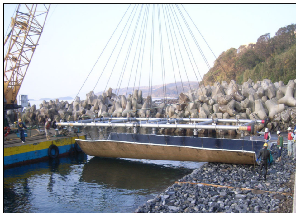
アスファルトマット敷設状況