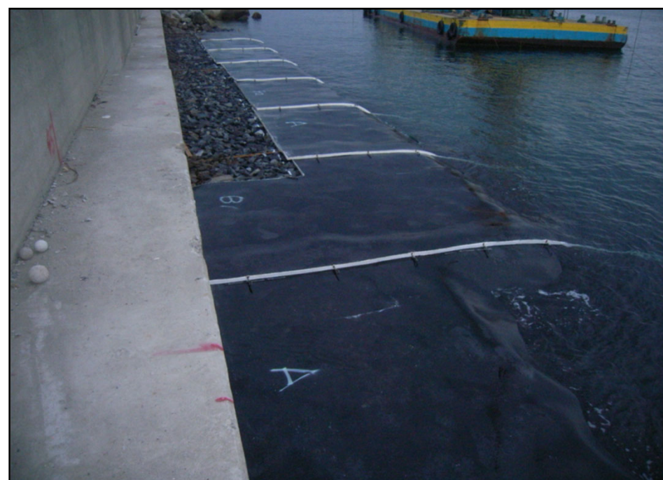
アスファルトマット敷設完了