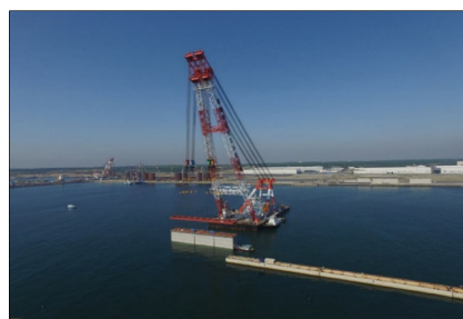
ケーソン据付け状況